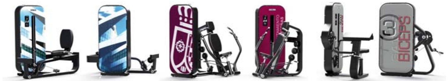
Ejemplos proyectos personalización línea ESSENCE..

Un sistema que permite la personalización de las máquinas ESSENCE utilizando una imagen, el logotipo de la instalación o desarrollando un diseño conceptual único y exclusivo para cada cliente.